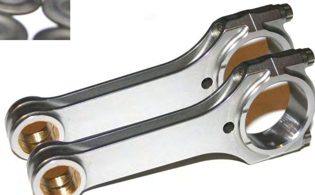
Bielle HFRS S